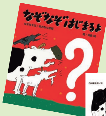
『なぞなぞはじまるよ』 おおなり修司／なぞなぞ文 高島純／絵 絵本館

絵本に、『オレ・ダレ』（講談社）、『おとうさんのえほん』（絵本館）、『どうぶつ しんちょうそくてい』（アリス館）、『十二支のことわざえほん』（教育画劇）、『どうするどうするあなのなか』（福音館）、『おおどろぼうヌースト』（ほるぷ出版）など。また童話のイラストに『ペンギンたんけんたい』のペンギンシリーズ、『モンスター・ホテルでおめでとう』のモンスター・ホテルシリーズなど、絵本を含め250冊以上の出版を手がける。