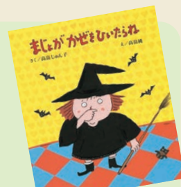
『まじよがかぜをひいたらね』 高島じゅん子／作 高島純／絵 理論社