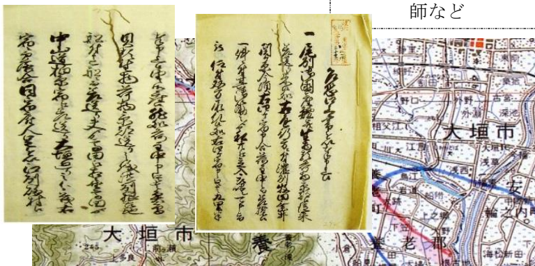
鰻輸送を示す文書 竹中家文書

出身：一宮市 現住所：名古屋市 略歴：名古屋大学大学院文学研究科日本史学専門修了 『新編安城市史』編さん事務局嘱託職員 『岐阜大学郷土博物館収蔵史料目録』(1)～(8)・別冊 (1)、『岐阜大学地域科学部地域資料・情報センター地域資料通信』創刊号～7号の編集 「岐阜大学教育学部郷土資料館の歴史資料」(『年報近現代史研究』第7号所収) 岐阜県歴史資料保存協会実施「古文書読解 講習会」講師など