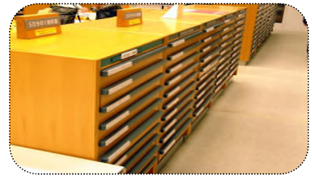
2階・地形図が入っている棚

地形図とは、正確な測量をもとにして山や川などの地形（地表の起伏状態など）を地図記号や等高線などで詳細に表した地図です。調べ学習や旅行、登山などに活用できます。