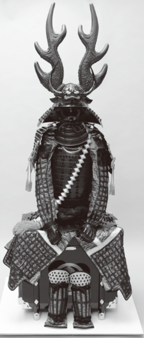
4.「本多忠勝甲冑」(複製)*