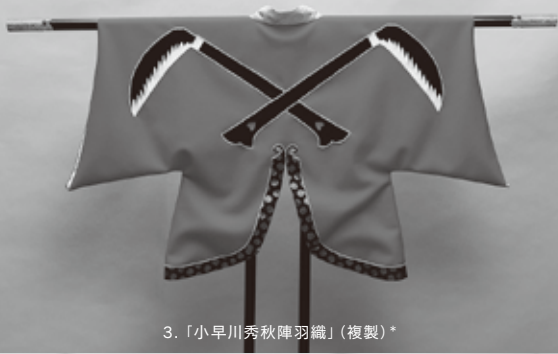
3.「小早川秀秋陣羽織」(複製)*