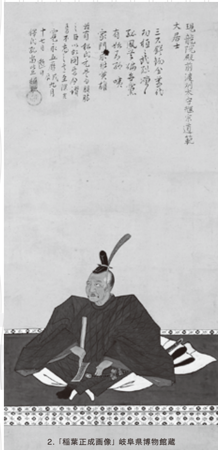
2.「稲葉正成画像」岐阜県博物館蔵

慶長5年(1600)美濃・関ヶ原で繰り広げられた天下分け目の戦い「関ヶ原合戦」、合戦自体はわずか一日で決着が付きましたが、その後200年以上に及ぶ日本の国の仕組みを決定づけた大一番でした。この戦いにおいて美濃の地が果たした役割を、その前哨戦として重要な位置を占める岐阜城合戦(城主織田秀信)を含め考察します。またその後、この合戦が岐阜の人々にいかに語り継がれたかを、各地に伝わる資料により紹介します。