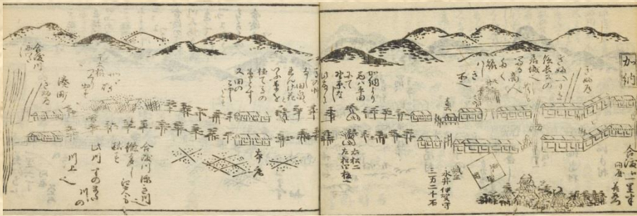
宝暦6年 木蘇路安見絵図(岐阜県図書館所蔵)