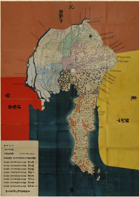
天保9年 尾張国絵図