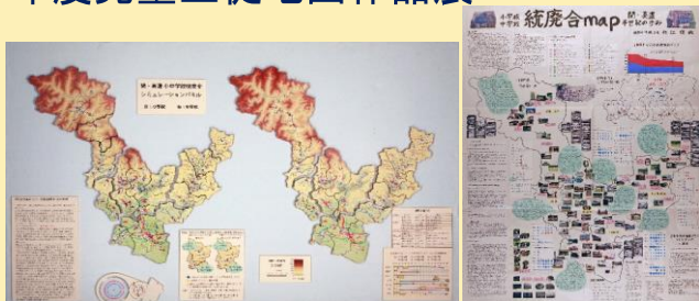
岐阜県知事賞 中2 杉江 俊哉さんの作品